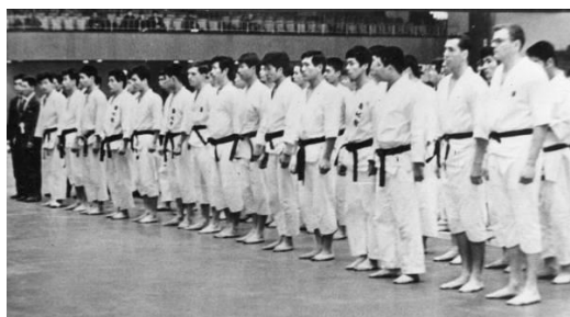
国際選手権大会 (昭和39年 東京体育館)