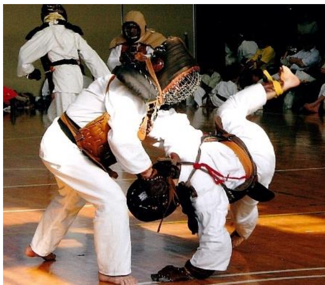
完全防具試合 (70年間無事故)